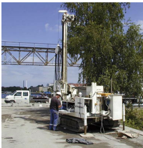
Udførelse af 6" miljøboringer.