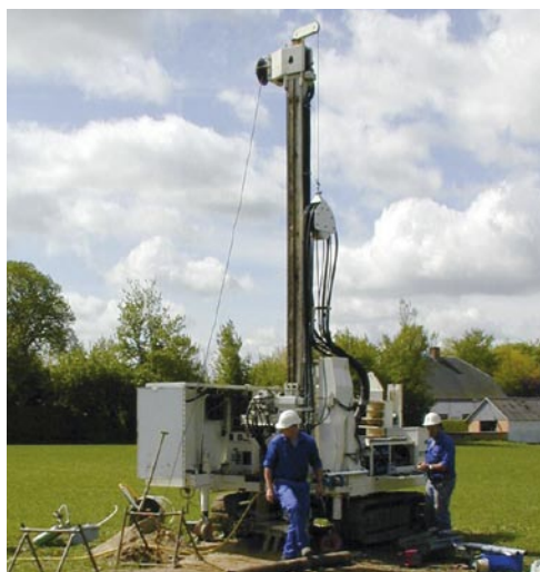
Udførelse af 6" geoteknik.

Til borearbejdet følger markjournal med alle relevante oplysninger jf. Aarsleffs KS-Håndbog for geotekniske og miljøtekniske boringer. Borejournal kan udarbejdes i BRegister/PC Jupiter samt indrapporteres til GEUS hvis det ønskes.